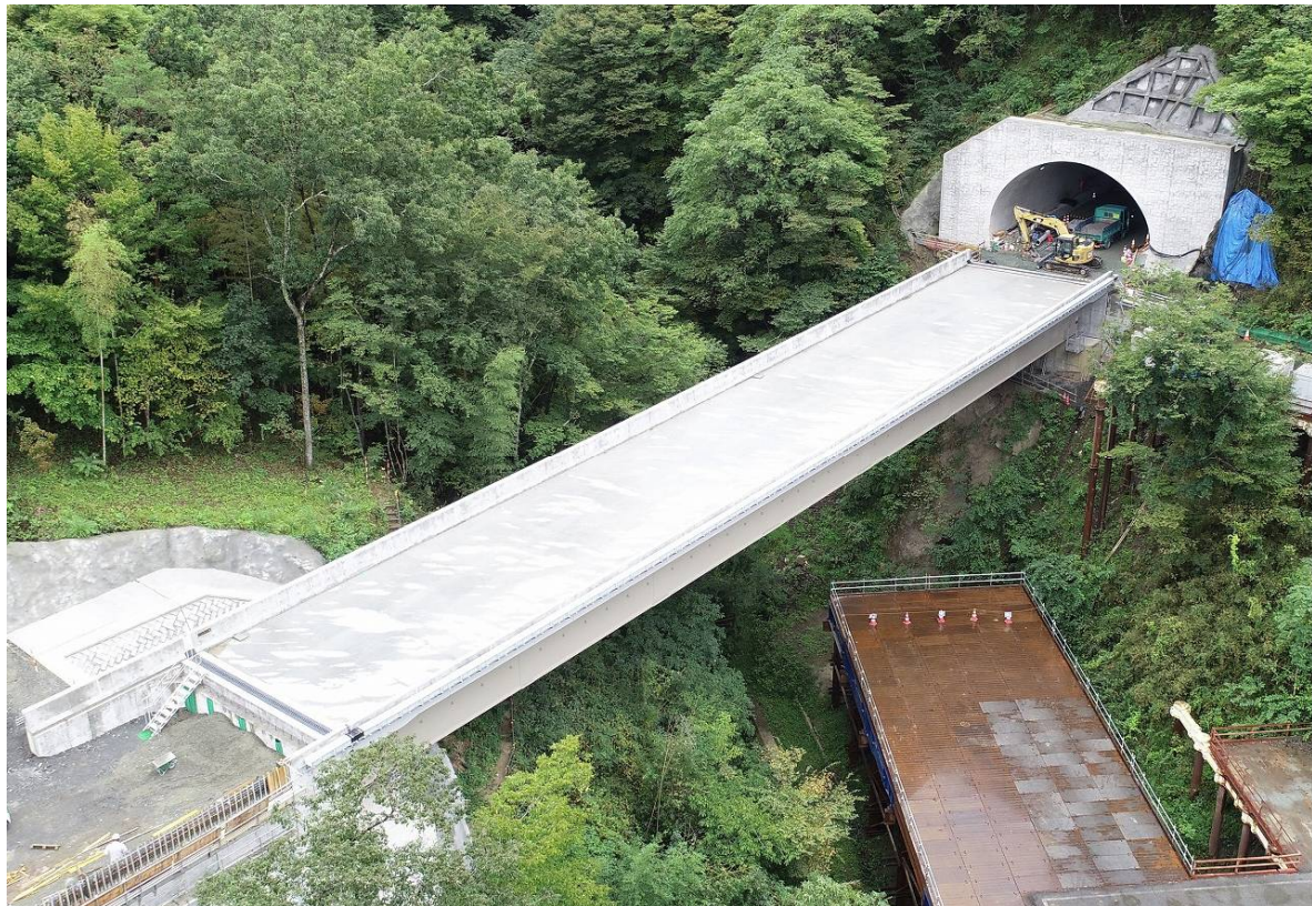
H29 中部横断小山沢川橋上部工事