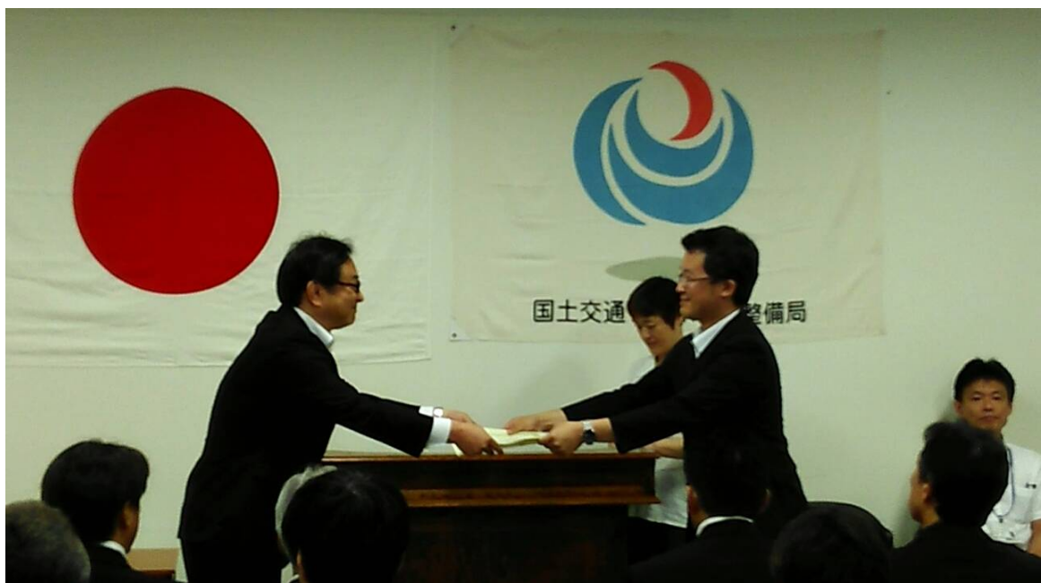
優良工事表彰を受ける香川東京支店長