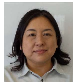
計画担当：坂本祐子

2025年10月に開始した鋼桁架設は間もなくP1橋脚に到達します。P6上空の高圧線（50万ボルト）およびP3上空の高圧線（27万5千ボルト）を無事に施工することができました。