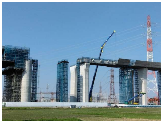
上牧地区の方々が見る架設作業風景

工事名 新名神高速道路 高槻東鋼桁上部工工事 工程 種別 地点 お花見 架工要集 2026/04/07